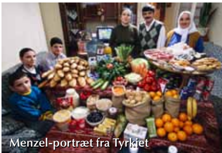
Menzel-portræt fra Tyrkiet