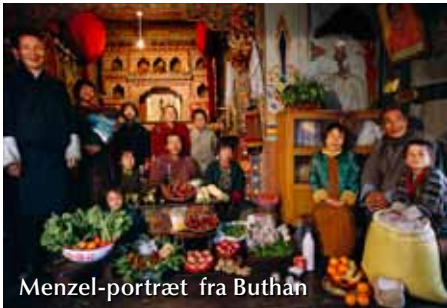
Menzel-portræt fra Buthan