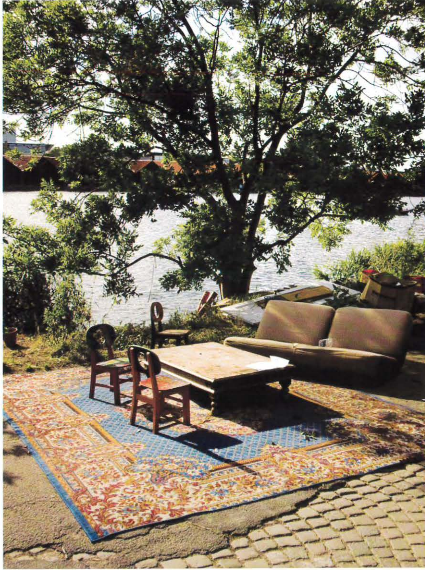
Møbler på Refshalevej