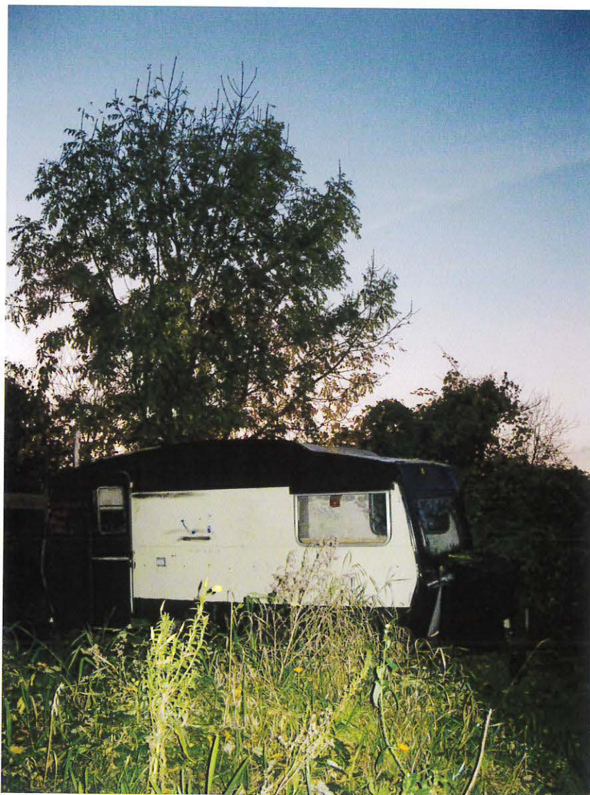
Campingvogn på Refshalevej