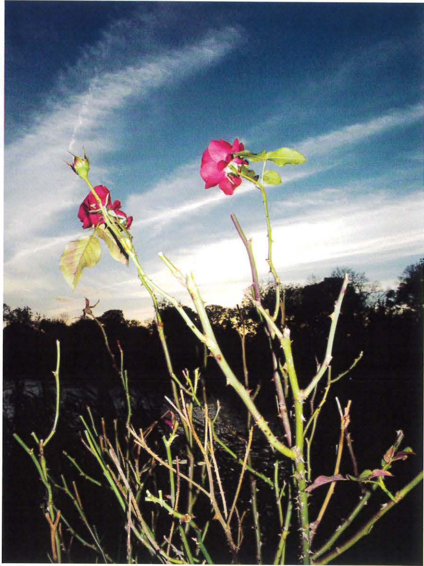
Roser ved Stadsgraven