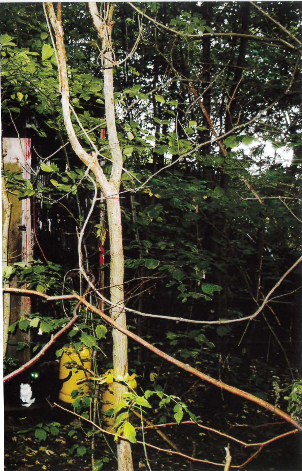
Beboelsesvogn i Nordområdet