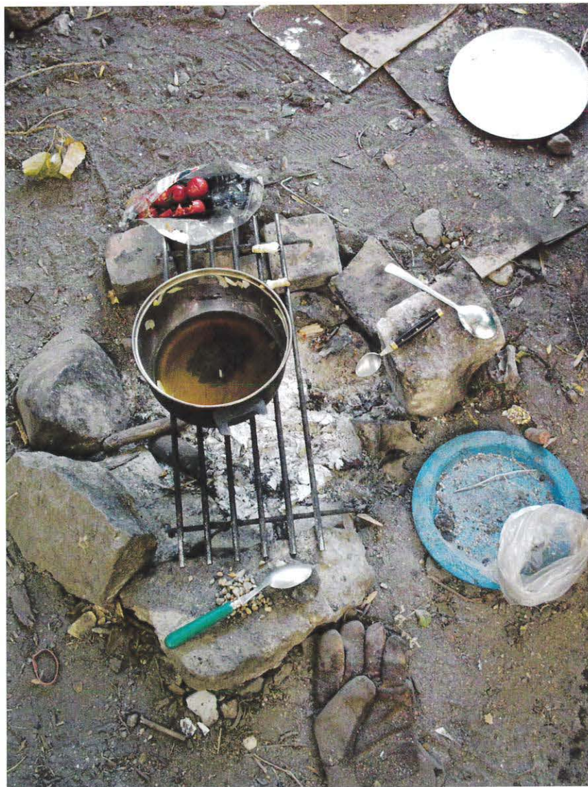
Bålplads på Volden I