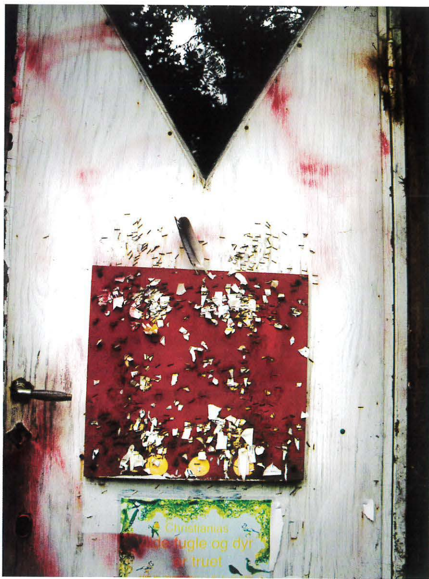
Toiletdør på Volden