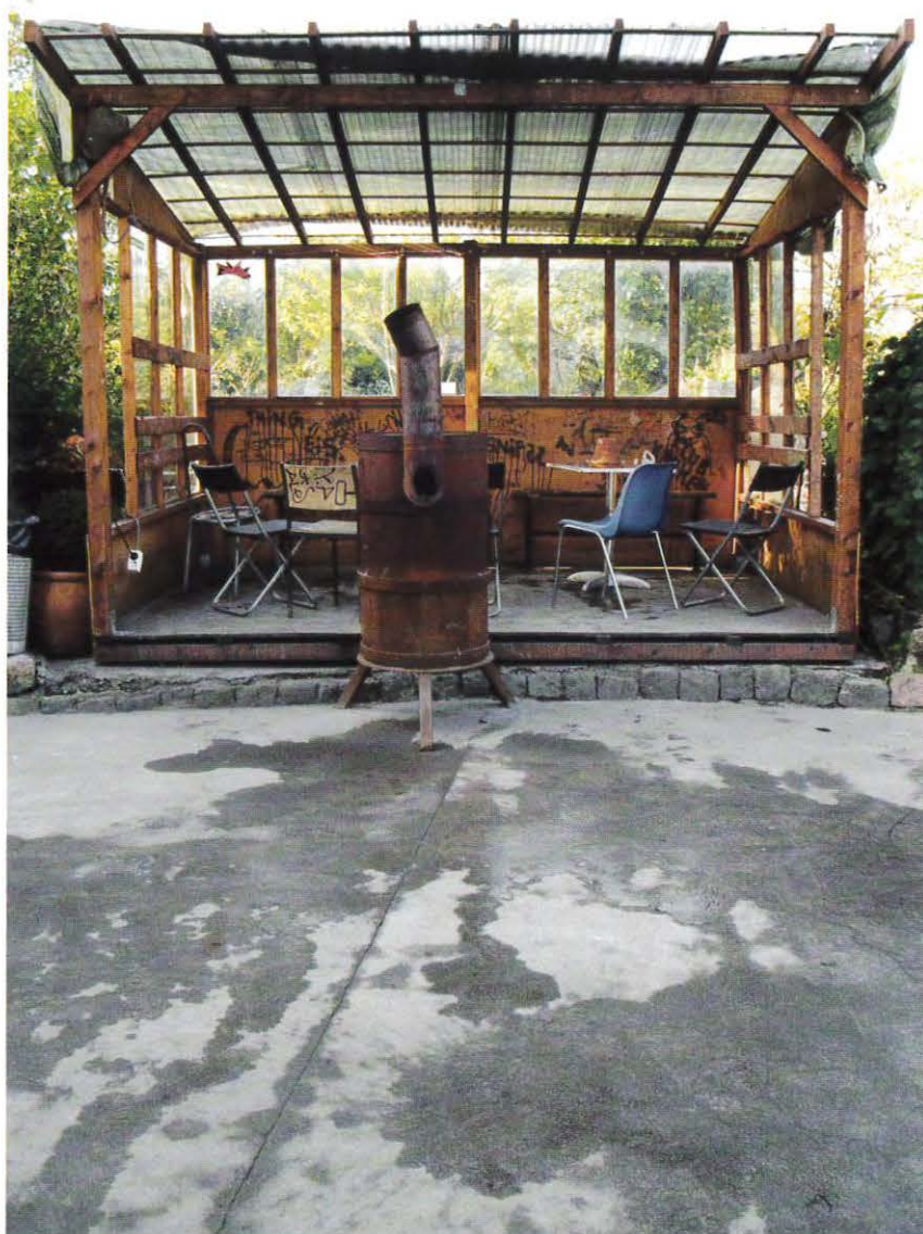
Pladsen ved café Månefiskeren