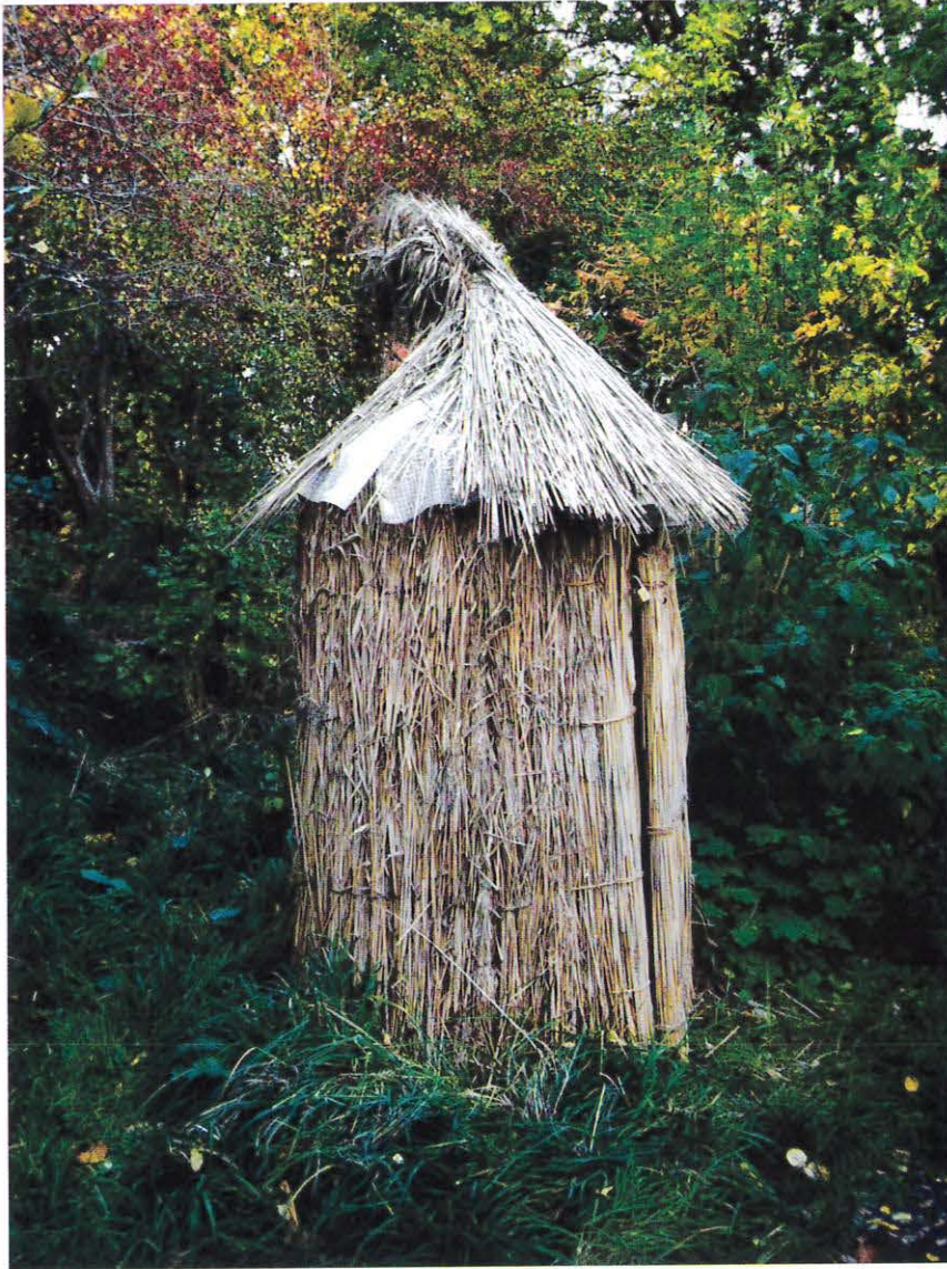
Muldtoilet i området Bjørnekloen