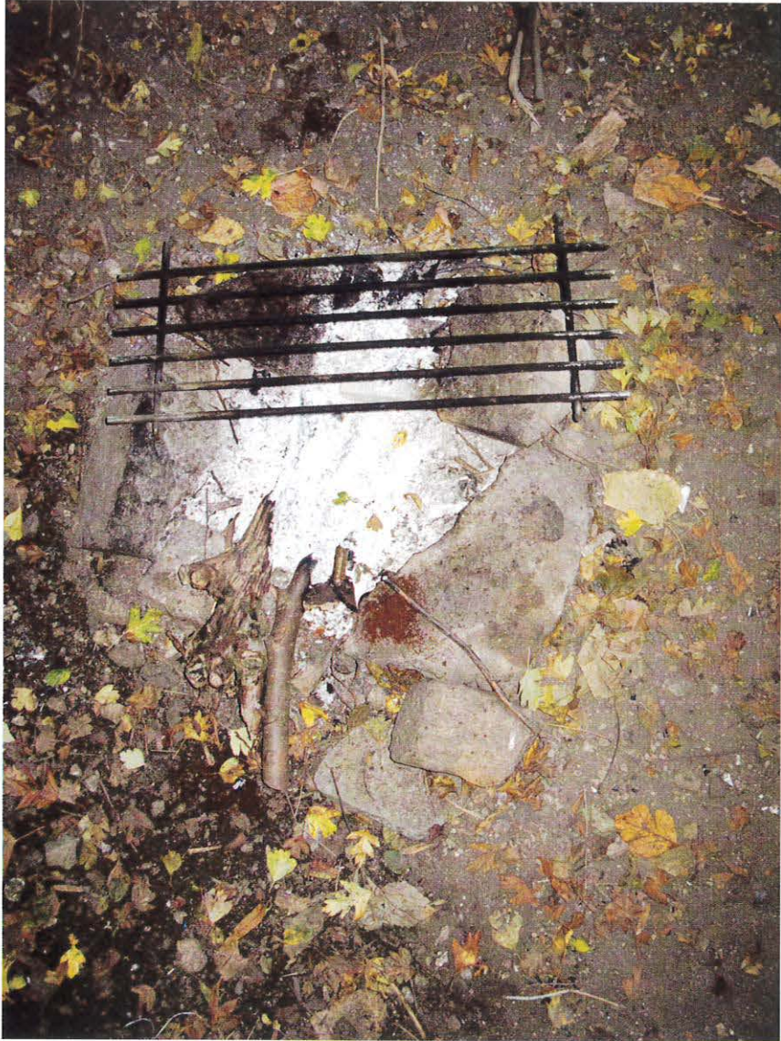
Bålplads på Volden II