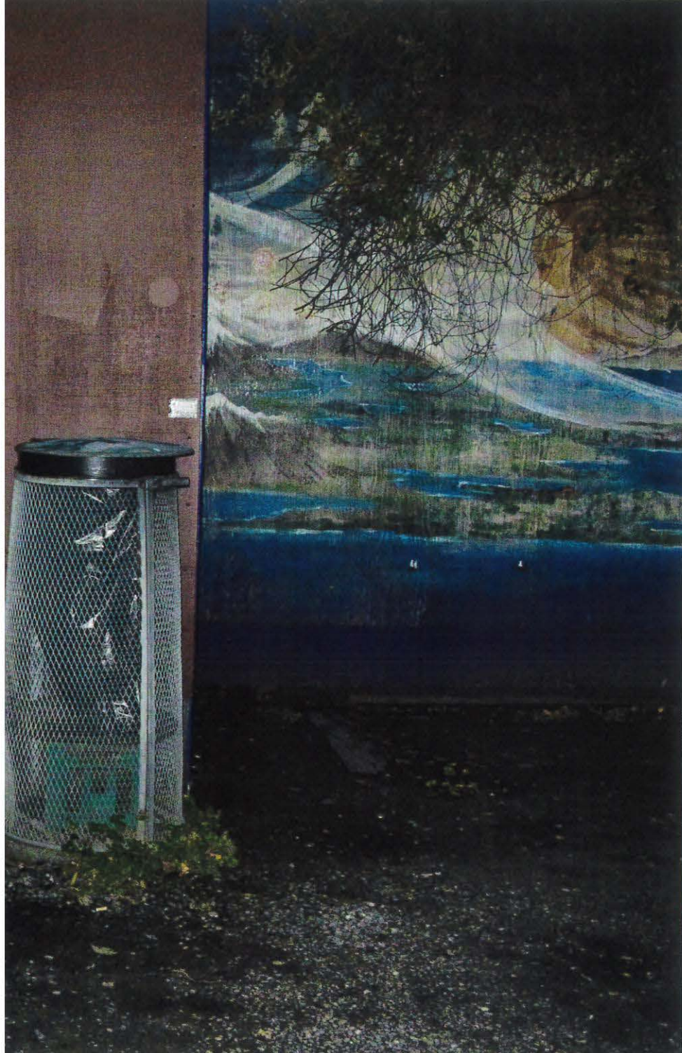
Væg ved café Nemoland