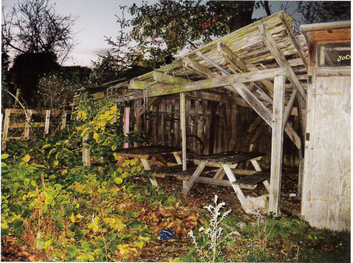
Halvtag i Langgaden