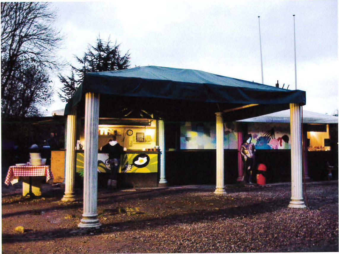
Pladsen foran café Nemoland