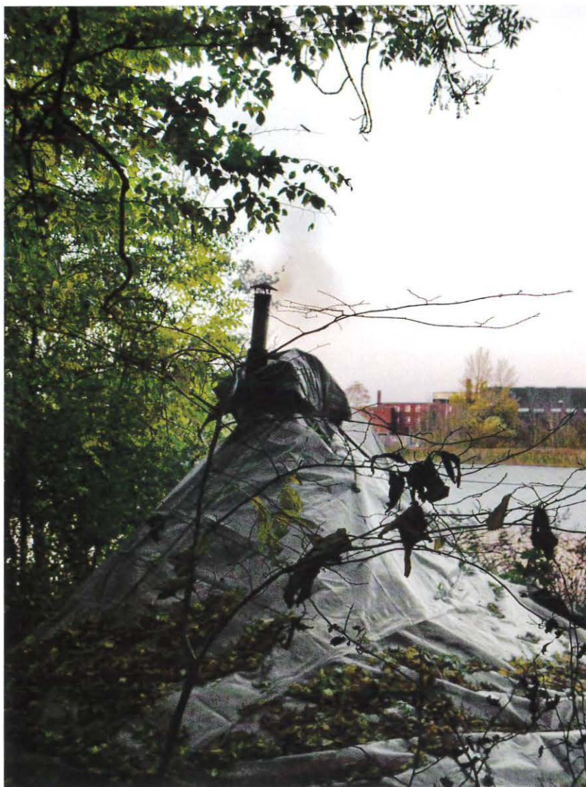
Boplads på Frederiks Bastion