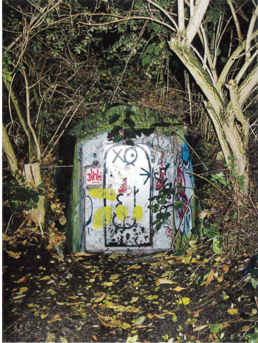
Graffiti på depot