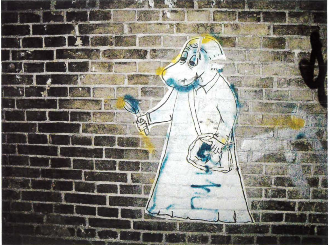
Vægudsmykning ved spillestedet Loppen