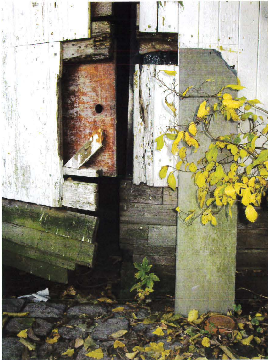
Redskabsskur på Syd Dyssen