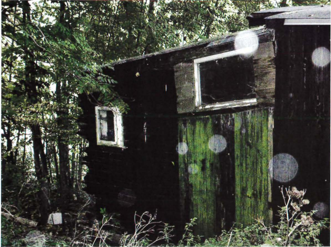
Hus ved Dyssebroen